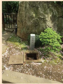
6 几号高低標 「西久保八幡神社」 7 二等三角点・几号高低標 「愛宕山」・愛宕神社の池