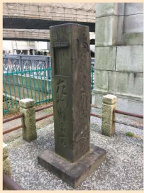
4 几号高低標「石橋、迷子(しらせ石)」「いっこく橋」