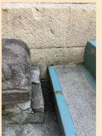
6 几号高低標「ニコライ堂」