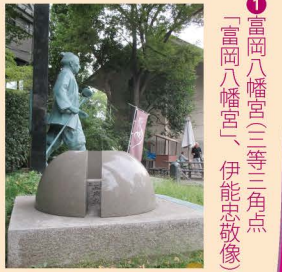
1 富岡八幡宮(三等三角点「富岡八幡宮」、伊能忠敬像)