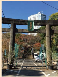
2 几号高低標「芝鹿島神社」 3 几号高低標「芝公園東照宮」