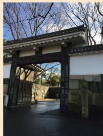
4 几号高低標「田安門」