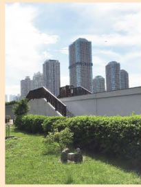
2 永代公園 (二等三角点「二ノ橋」)