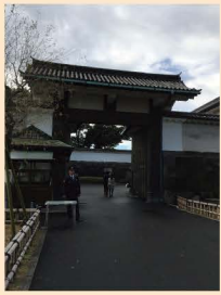
5 几号高低標「大手門」