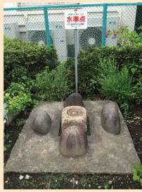
3 霊岸島(一等水準点「交無号」、水位観測所、量水標跡)