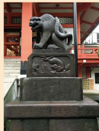
1 几号高低標 「神楽坂毘沙門天」