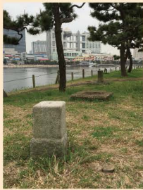
1 三等三角点「三番台場」