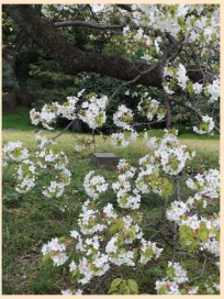
6 江戸城天守台跡 (二等三角点「本丸」、几号高低標「天守台」、天守台中段の未解決の測点)