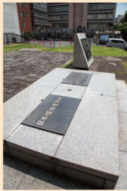
4 几号高低標 「麻布飯倉狸六坂上」 5 日本経緯度原点