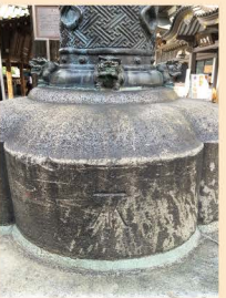
7 几号高低標「湯島天満宮」 ○湯島聖堂、神田明神