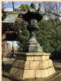
3 几号高低標 「靖国神社大灯笼」