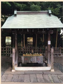
2 几号高低標 「市ヶ谷亀岡八幡宮」