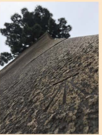
10 几号高低標「桜田門」 11 几号高低標「大手門」 12 几号高低標「江戸城天守台」