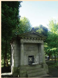
8 几号高低標「日比谷公園」 烏帽子石・亀石 9 日本水準原点・一等水準点 「甲」「乙」「丙」「丁」「戊」